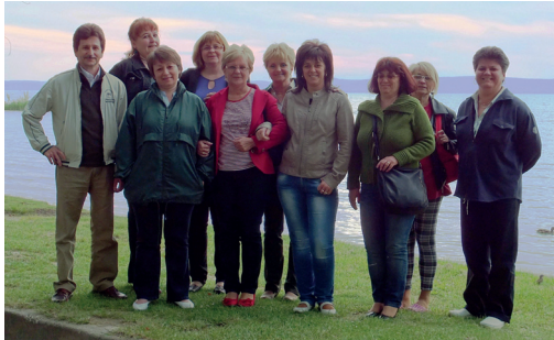
Elköszönnek a megfogyatkozott létszámú üzemi tanács tagjai

2012. november 22-én került megkötésre a munkáltatóval az üzemi tanács működéséhez, a részvételi jogok gyakorlásához szükséges feltételek biztosításáról az ÜZEMI MEGÁLLAPODÁS. A jelenleg hatályos megállapodás a törvény (új Mt. 205. § és 206.§) által az állami vállalatok számára szűkre szabott és korlátozott mozgásterén belül szabályozta az együttműködés formáit és lehetőségeit.