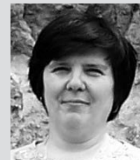
LAKNER RITA (Debreceni SZSZT)

Anita 2004 novemberében lépett be a Magyar Postához és azonnal tagja lett a Postás Szakszervezetnek. Budapest 10 Postán dolgozik jelenleg is főpénztáros munkakörben. Amikor a korábbi alapszervi titkár GYES-re ment, gyakorlatilag utódjául jelölte őt, és a tagság egyhangúan meg is választotta az alapszervezet vezetőjének. Később, amikor ő ment GYES-re, már tudta, hogy visszatérése után szívesen folytatná a szakszervezeti munkát. Ezt a tagok is így gondolták, és visszavárták. Idén újraválasztották Budapest 10 Posta alapszervezetének titkárává. Fiatal, lendületes, másokon segíteni igyekvő, őszinte embert ismertünk meg személyében.