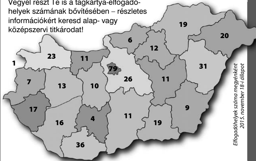
Elfogadóhelyek száma megyénként 2015. november 18-i állapot

Tagsági kártyád felmutatásával az ország számos pontján vehetsz igénybe kedvezményes vásárlási lehetőségeket és szolgáltatásokat. Vegyél részt Te is a tagkártya-elfogadóhelyek számának bővítésében – részletes információkért keresd alap- vagy középszervi tittkárodat!