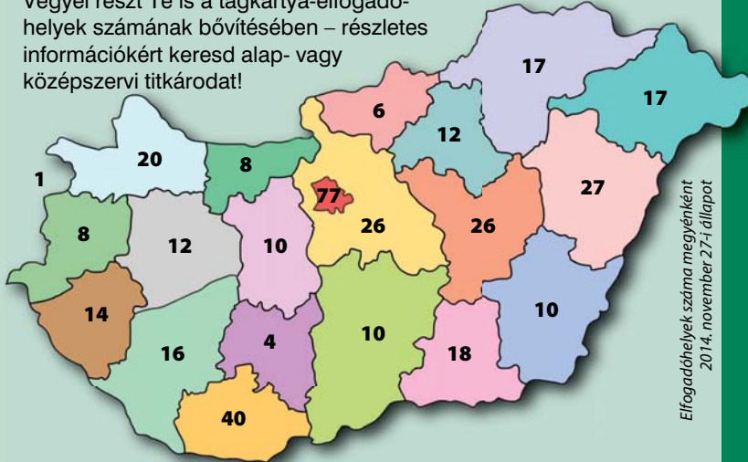
Elfogadóhelyek száma megyénként 2014. november 27-i állapot

Tagsági kártyád felmutatásával az ország számos pontján vehetsz igénybe kedvezményes vásárlási lehetőségeket és szolgáltatásokat. Vegyél részt Te is a tagkártya-elfogadóhelyek számának bővítésében – részletes információkért keresd alap- vagy középservi titkárodat!