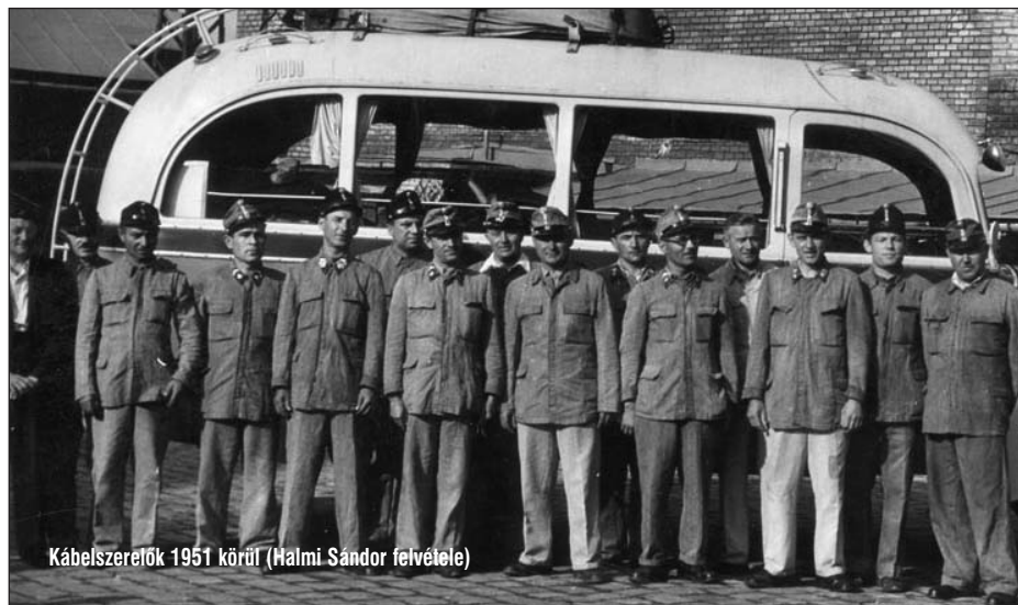
Kábelszerelők 1951 körül